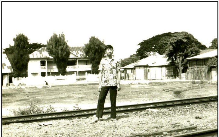
โรงเรียนแกงกวง เมื่อปี 2512

ช่วงเวลา เด็กเรียนของบ้ายวันหนึ่ง(ปี 2504) ขณะที่ปิงกำลังเก็บอุปกรณ์สมุดหนังสือลงกระเป๋าคงจะเดินกลับบ้าน ไอบ่บ่เกี้ยก มันก็วิ่งเข้ามากระตุกแขนปิงเพื่อเชิญชวน