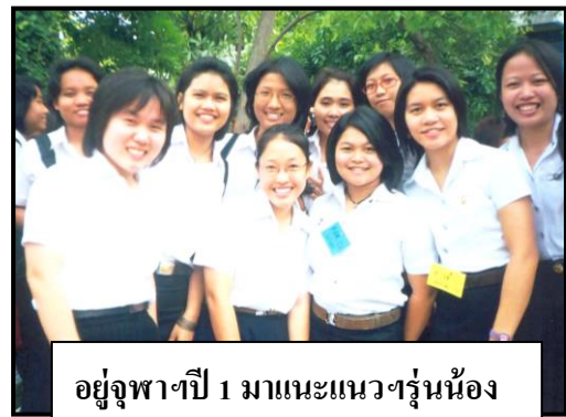
อยู่จุฬาฯปี 1 มาแนะแนวฯรุ่นน้อง

“ฟุ่มเฟือย สรุ่ยสรุ่ย ตามใจลูก ๆ ไม่เข้าเรื่อง”